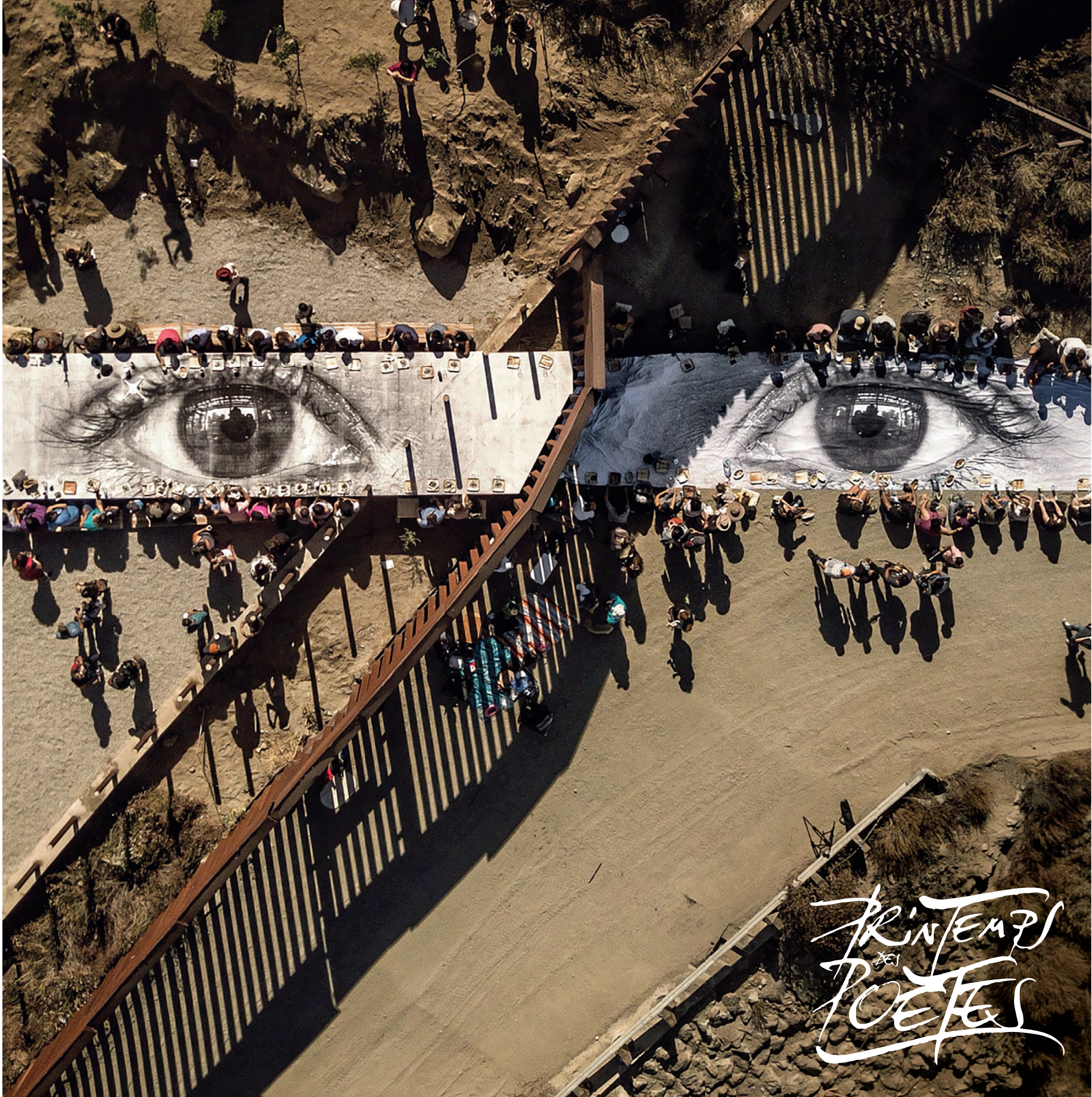
Migrants, pique-nique à travers la frontière, Tecate, Mexique - USA, 2017 © JR